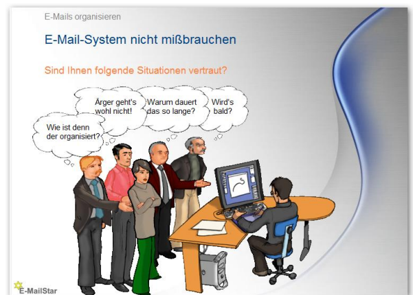
Szenen aus dem Kurs